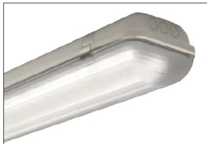
2 x LED-Platine