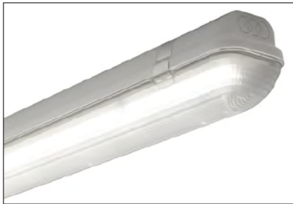
1 x LED-Platine

Luminaire étanche LED IP65. Corps en polycarbonate, moulé par injection gris. Diffuseur en polycarbonate, moulé par injection, face extérieure lisse. Crochet de fixation inox. Thermorésistance jusqu'à 850°C. Durée de vie moyenne 50'000h. Couleur des sources 840. Température de couleur 4000K. Incompatible dans les milieux en présence de vapeurs affectant l'utilisation de matières plastiques.